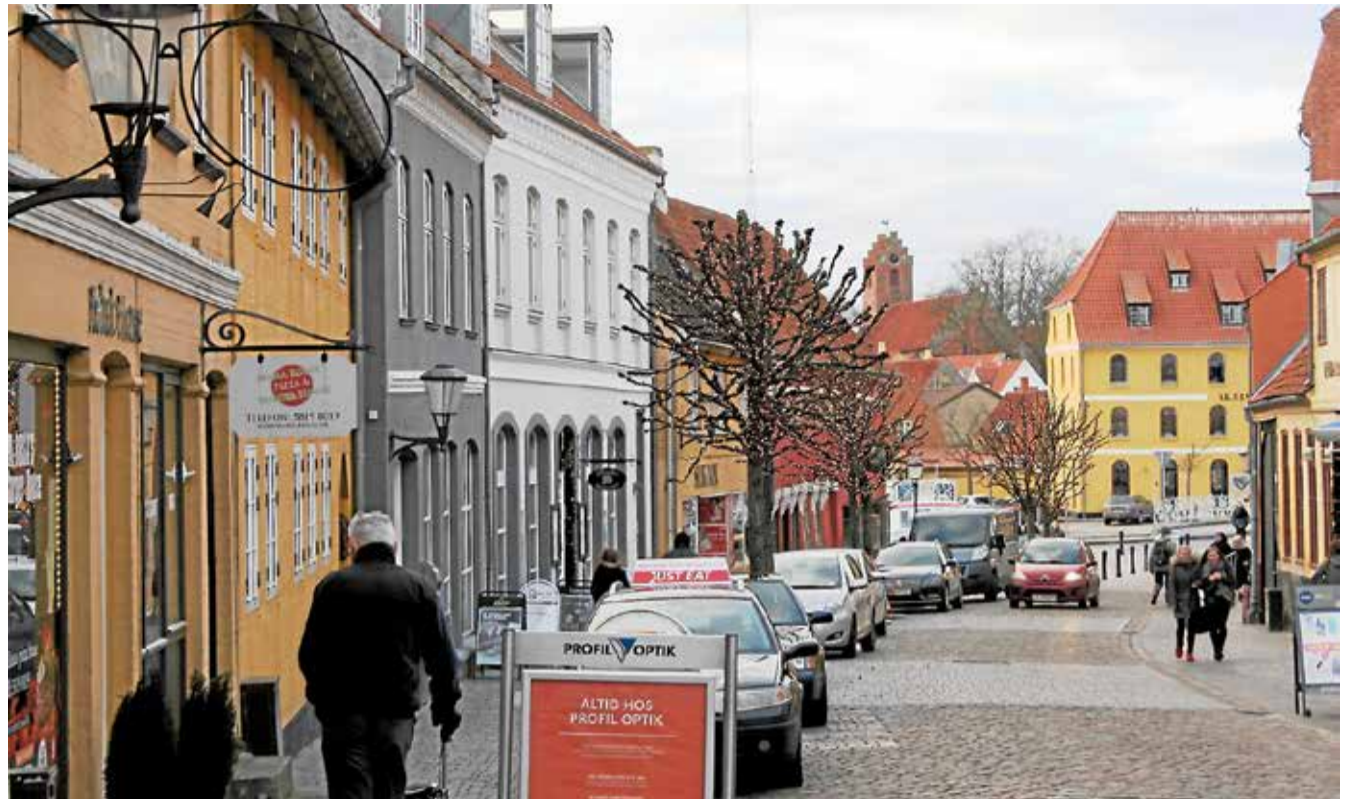
Der skal være liv i Algade. Tomme butikker kan udnyttes til særlige oplevelser i perioder.